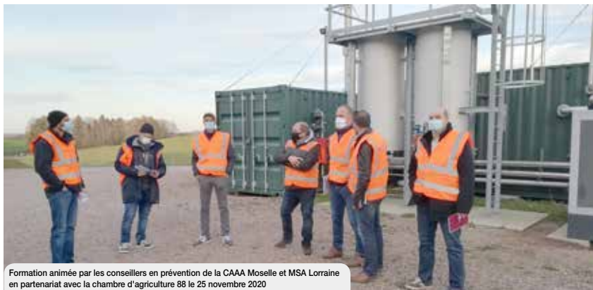
Formation animée par les conseillers en prévention de la CAAA Moselle et MSA Lorraine en partenariat avec la chambre d'agriculture 88 le 25 novembre 2020

Ces dernières années, l'implantation d'installations de méthanisation s'est multipliée sur tout le territoire lorrain. De capacités variables, elles permettent d'offrir des compléments d'activités et ressources pour la plupart des exploitants concernés.