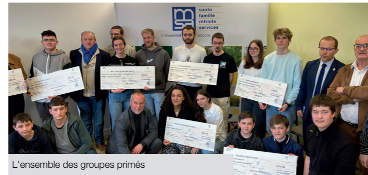
L'ensemble des groupes primés

Chaque projet primé a été honoré d'une bourse. Une récompense pour l'audace et le travail accompli mais aussi un moyen pour concrétiser les idées et les faire rayonner encore plus loin. L'avenir de ces initiatives et projets ne s'arrête pas à cette remise de prix. Certains projets pourront concourir au niveau national, avec une remise de prix qui aura lieu en mai à Paris.