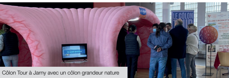
Côlon Tour à Jarny avec un côlon grandeur nature

À l'occasion de ce mois de prévention, la MSA Lorraine se mobilise, aux côtés de ses partenaires, pour informer, sensibiliser et accompagner ses assurés dans le dépistage, au travers de différents temps forts, comme l'accueil, le 31 mars à Jarny, du Côlon Tour !