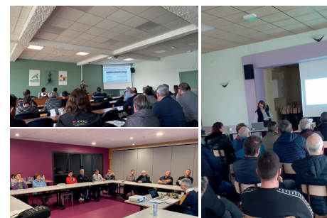
11 réunions organisées en Meurthe-et-Moselle, en Moselle et dans les Vosges.