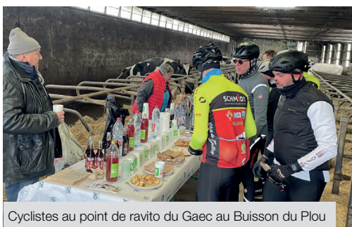
Cyclistes au point de ravito du Gaec au Buisson du Plou