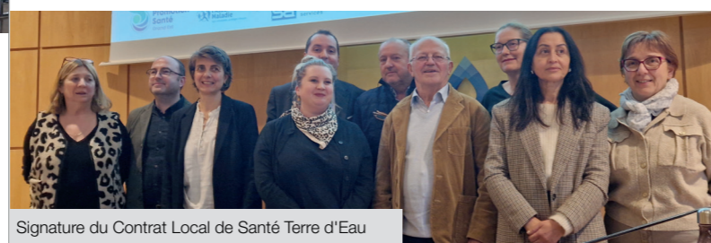
Signature du Contrat Local de Santé Terre d'Eau

Cette signature illustre une volonté collective forte : faire de la santé un levier majeur de qualité de vie et de cohésion territoriale pour l'ensemble des 45 communes de Terre d'Eau.