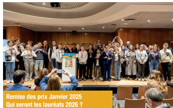
Remise des prix Janvier 2025 Qui seront les lauréats 2026 ?

Pour participer, formez un groupe d'au moins 3 jeunes de 11 à 22 ans, assurés à la MSA ou vivant en milieu rural. Accompagnés par un correspondant jeunesse, vous pourrez développer un projet autour de thématiques variées - de l'alimentation aux publics fragilisés, en passant par la culture, le sport, etc. Les candidatures sont ouvertes jusqu'au 9 janvier 2026.