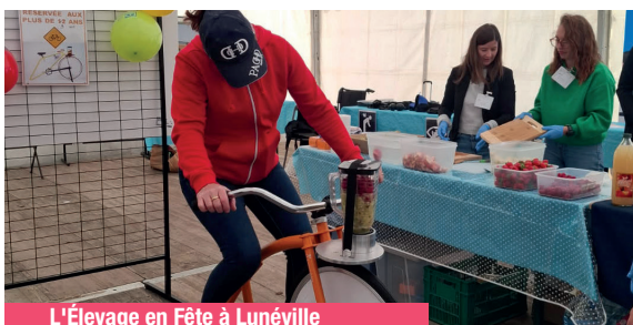
L'Élevage en Fête à Lunéville