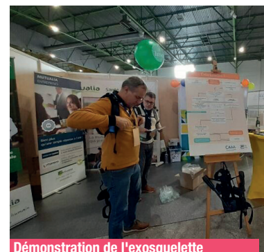
Démonstration de l'exosquelette