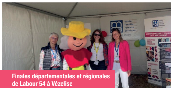
Finales départementales et régionales de Labour 54 à Vézelize

Au programme, des échanges, des démonstrations, des animations pour petits et grands et des moments pour (re) découvrir le monde agricole et la MSA autrement !