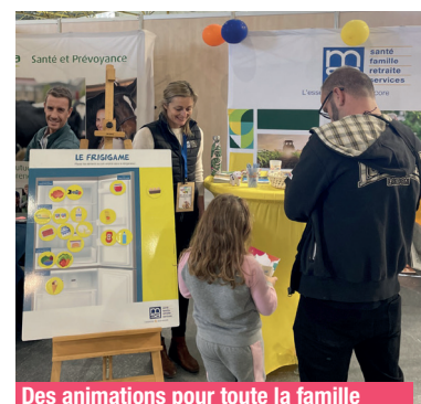
Des animations pour toute la famille

En parallèle, nos équipes ont animé tout au long du salon, des activités ludiques destinées à toute la famille. Les visiteurs ont ainsi pu tester leurs connaissances sur la Sécurité Sociale en faisant tourner notre célèbre roue lors d'un quiz, ou encore relever le défi du Frigigame, un jeu consistant à placer correctement les aliments dans le réfrigérateur. Un exercice plus difficile qu'il n'y paraît !