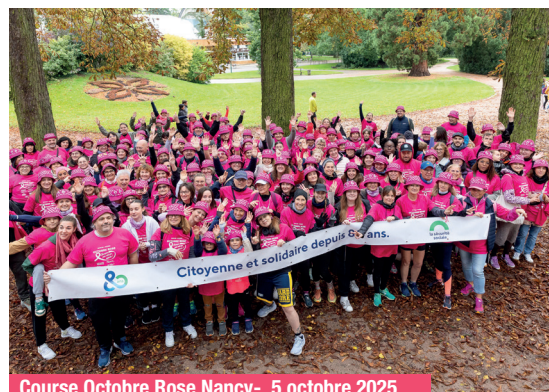
Course Octobre Rose Nancy - 5 octobre 2025

Délégués et collaborateurs MSA Lorraine ont pour l'occasion porté les couleurs d'Octobre Rose sur les parcours proposés à Nancy, Metz et Épinal. Bravo à tous !