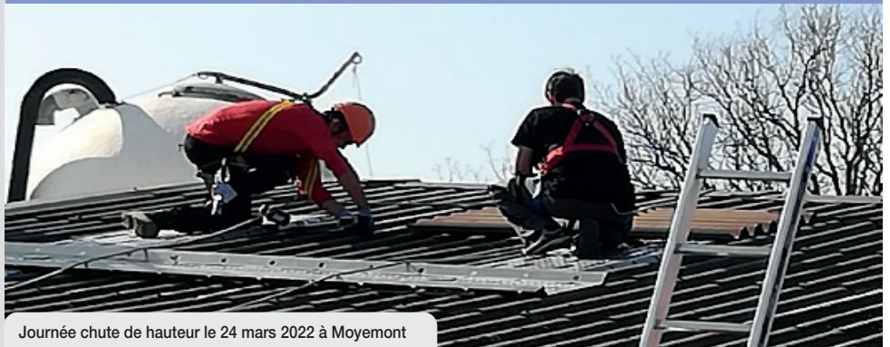
Journée chute de hauteur le 24 mars 2022 à Moyemont

« Dans une société où tout va vite, je ne peux pas attendre et si je veux que ça marche, je fais moi-même » ... Le travail en hauteur représente une source de risques importants et nécessite la mise en œuvre de moyens techniques et de procédures auxquels chacun devrait consacrer du temps.